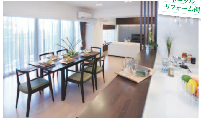
トータル リフォーム例