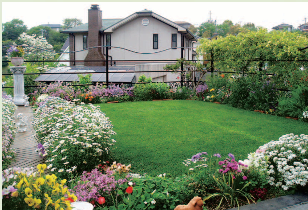
After 一年中青々と美しい西洋芝。陽射しの照り返しを防ぐので、夏でも涼しい。庭が広くて水やりが大変なときは、スプリンクラーの設置も行ってくれる。