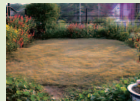
Before 施工前のN邸の庭。花の種類が少ない冬には日本芝も枯れてしまい、どことも寂しい庭になっていた。

自由に裁断できる「三種混合ロール巻芝」。擦り切れに強いので、サッカー場や幼稚園の庭にも使用されている。