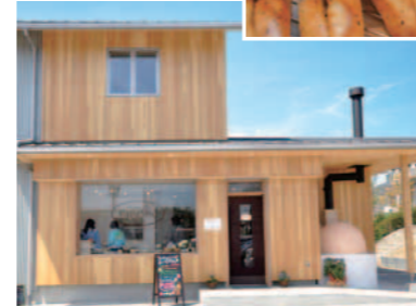
「電子水」と昔ながらの製法にこだわる、無添加の手作りパン工房「ハバシユ」。焼きたてのパンを求めて、遠方からわざわざ足を運ぶお客様も。