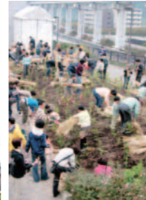
「かぐら」の裏手にある小さな森は、3年前に地域の方々と一緒に植樹したもの。その後大地にしっかりと根付き、四季折々の花を咲かせている。