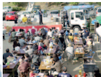
「くらしの杜」オープン記念として、毎年11月に行われる感謝祭。さまざまな楽しいイベントを開催し、たくさんの方が集まる。